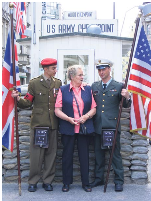
Abbildung 4: „Grenzbeamte“, Touristin

Die Initiativen des Senats („exhibition as knowledge“), des Museum Haus am Checkpoint Charlie („exhibition as museum dis-