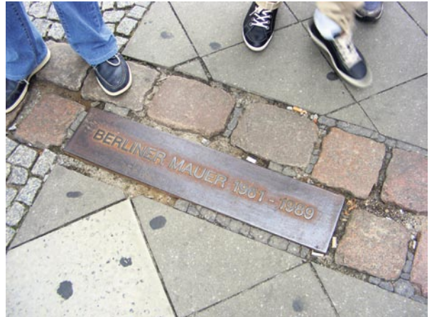
Abbildung 2: Ehemaliger Mauerverlauf

Bereits im 18. Jahrhundert war in Plymouth die Stelle, an der 1620 die erste Pilgerin ihren Fuß auf amerikanischen Boden gesetzt hatte, mit einer Gravur versehen worden ( Abbildung 1 ). Der so markierte Plymouth Rock wurde 1920 mit einem kunstvoll gestalteten Portikus überbaut, der den Fels weithin sichtbar machen sollte. Um auch die Lebenswelt der Pilgerinnen und Pilger anschaulich werden zu lassen, wurde in den 1940er Jahren ganz in der Nähe die Plimoth Plantation eröffnet. Sie bestand aus einem Museum, das Fundstücke der Ausgrabungsstätte des alten Pilgerdorfs präsentierte, und Plimoth Village, einer Rekonstruktion des Dorfes, das mit epochengerecht kostümierten Schauspielerinnen und Schauspielern belebt war. Diese sollten den Besucherinnen und Besuchern