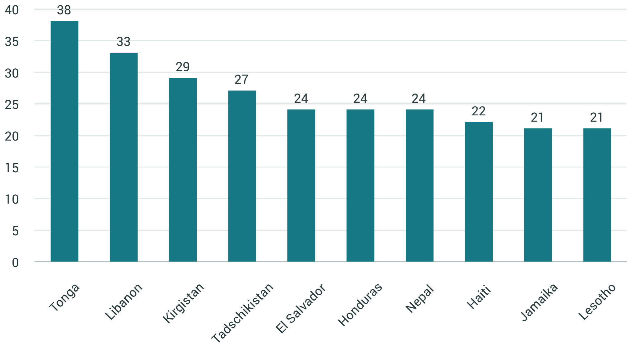
Im Verhältnis zum BIP (in Prozent)