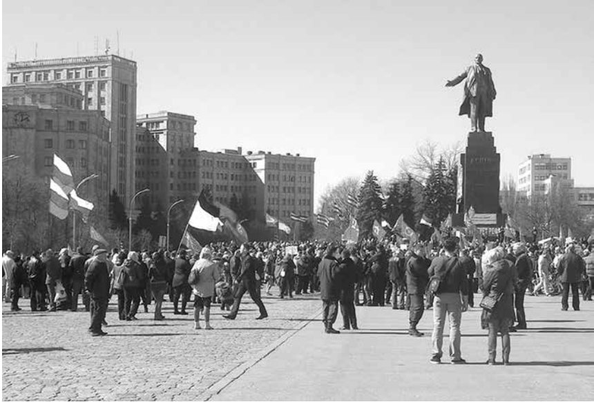
Пророссийская демонстрация перед монументом Ленину, весна 2014 года.

дальнейшей поляризации и радикализации, предложило демонтировать памятник легальным, цивилизованным образом, другие же не соглашались с этим, считая, что дальнейшее промедление как раз и приведет к усилению поляризации и радикализации.