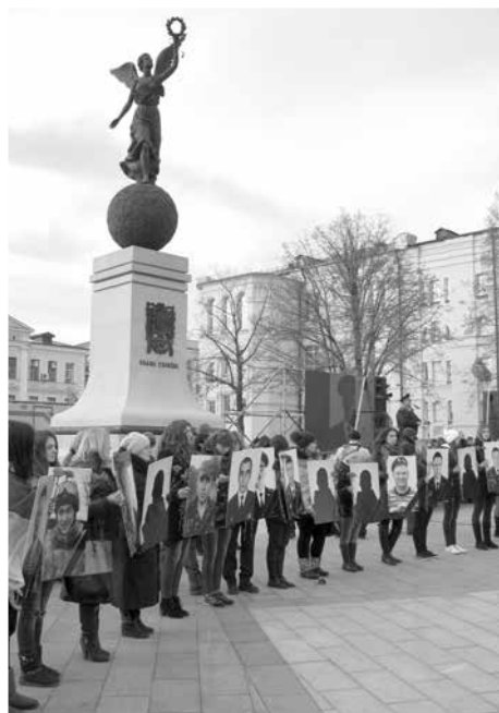
Площадь Конституции после реконструкции: митинг в память об украинских солдатах, погибших на Донбассе, 22 февраля 2015 года.