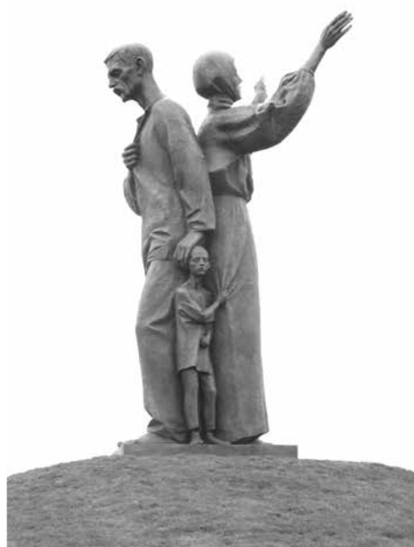
Мемориал памяти жертв Голодомора, Харьков, ноябрь 2008 года.