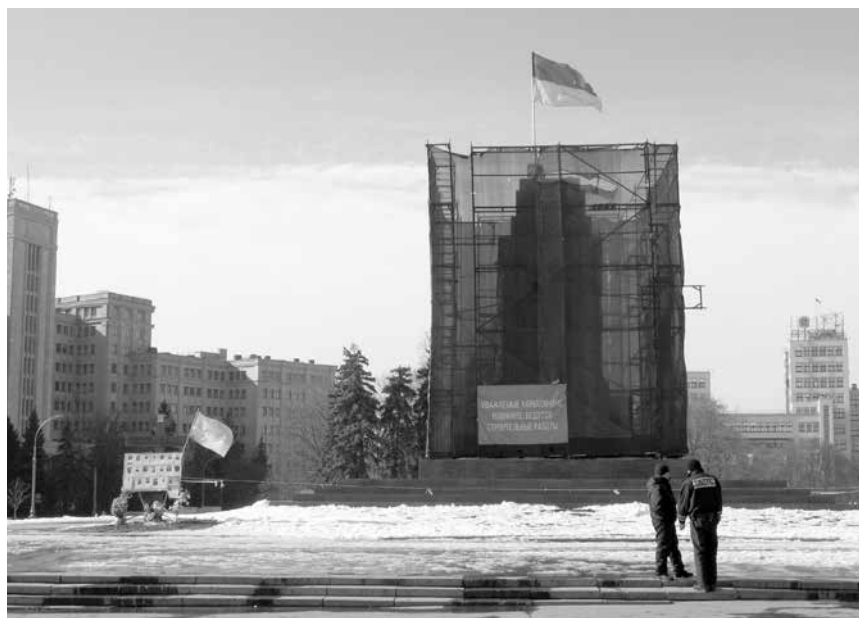
Основание демонтированного монумента Ленина на площади Свободы и алтарь в память о солдатах, павших на Донбассе, февраль 2015 года.

накануне предстоящих выборов в парламент. Силовики (милиция и СБУ) опасались уличных беспорядков. Одним из аргументов противников демонтажа было опасение, что массивная статуя может вызвать обрушение расположенной ниже станции метро (необоснованное беспокойство, так как скульптура оказалась полой). Однако демонстранты не хотели дожидаться официального разрешения и начали демонтаж статуи. Некоторые очевидцы сообщали, что демонстранты предварительно изучили проектную документацию к памятнику и действовали довольно продуманно. В техническом отношении их поддержали харьковские альпинисты, которые в 2010 году уже участвовали в протестах против вырубki деревьев в Парке Горького.