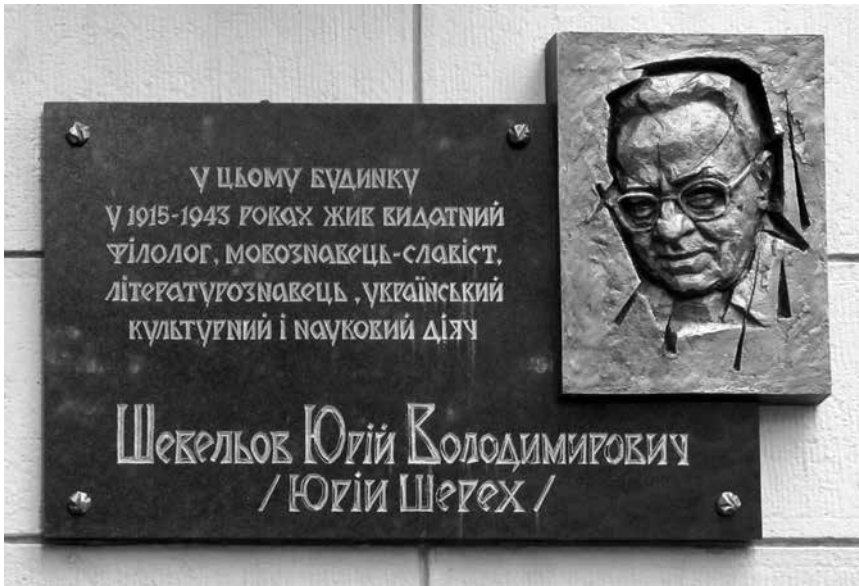
Мемориальная доска Юрию Шевелю, демонтирована в сентябре 2013 года.

суд отказал городскому совету и городскому голове Кернесу в праве на демонтаж доски (Соупаш, 2015). Полученное в 2011 году разрешение на ее установку сохранило свою силу и таким образом потребность в новом разрешении отпала. 12 Юридическую битву проукраинские активисты выиграли, однако конфликт все еще далек от разрешения. Хотя мемориальная доска уже отреставрирована, она все еще не установлена — в нынешней атмосфере политического противостояния она, вероятно, не провисела бы и недели.