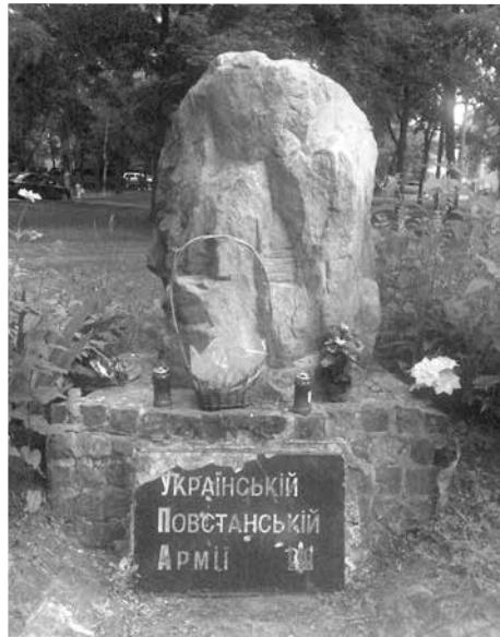
Памятник УПА в Молодежном парке Харькова, октябрь 2007.

Два приведенных примера демонстрируют, что в маргинальном статусе альтернативной исторической памяти, которая противоречила советскому мифу, мало что изменилось и после Оранжевой революции. Кроме того, вопреки указу президента Ющенко от 2009 года, который предписывал «демонтаж памятников и памятных знаков, посвященных лицам, причастным