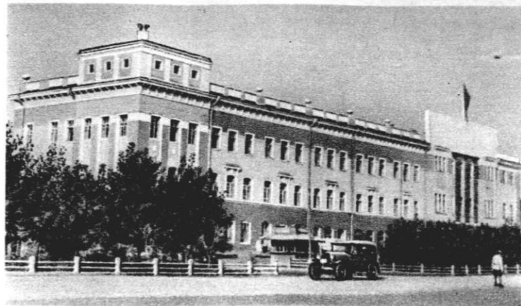
Дом правительства в г. Энгельсе.